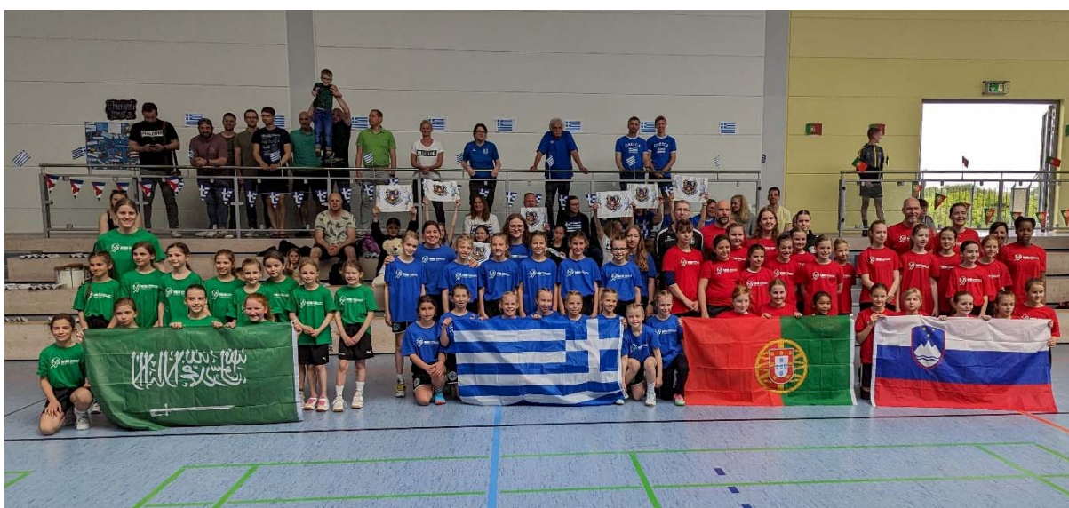
Gruppe 1 (in Bornheim)